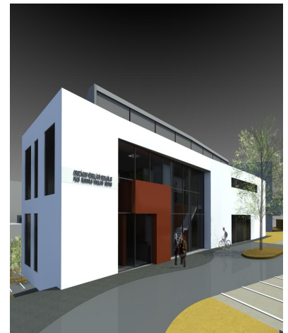
Pécsi Regionális Vérellátó Központ - látványterv

Pécsi Alapkőletétel- a fotókat Kabáth Dóra készítette: